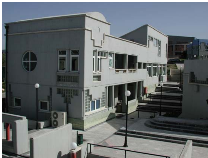
Όψεις των εγκαταστάσεων του Τμήματος Φιλολογίας